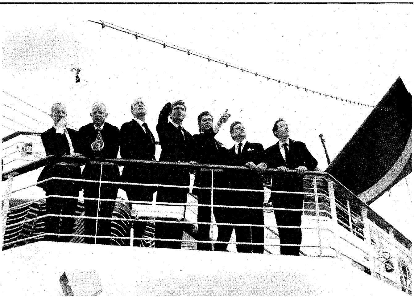
Zanggroep Frommerrmann: 'Onze voorstelling is een muzikale impressie van zo'n reis met de Holland-Amerika Lijn in de jaren dertig.'